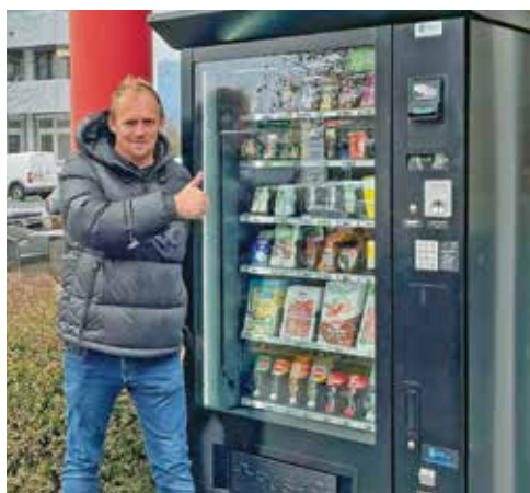
Der neue Snack- und Lebensmittelautomat steht rund um die Uhr bereit!

Lieferanten von Mr. Coffee nochmals zu diesem vielversprechenden Konzept, das in kürzester Zeit und mit viel Liebe zum Detail erfolgreich verwirklicht wurde. Wir können die frischen Produkte von Mr. Coffee und der Bäckerei Brandl wirklich empfehlen. Und es ist sehr schön zu sehen, dass sich sehr viele unserer Mitbürger*innen bereits vom tollen Angebot überzeugen und unsere heimischen Betriebe unterstützen.