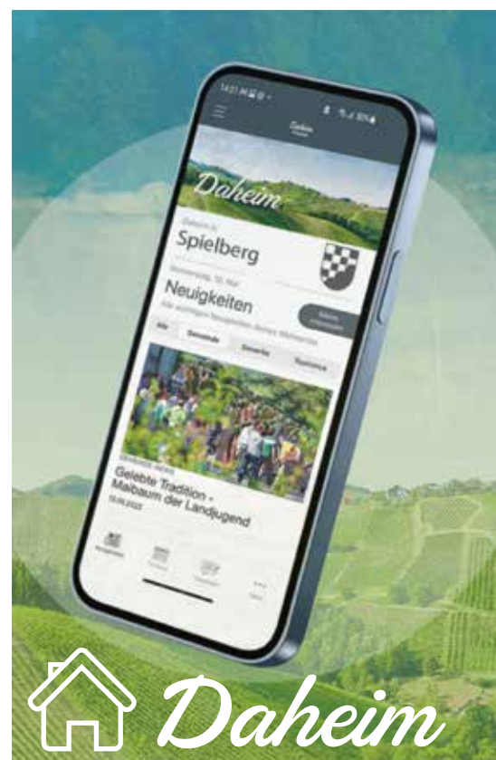
Die Service App von Saubermacher & Joliao (daheim-app.at)

Wir werden rechtzeitig vor dem Start auch Informationsmaterial und Anleitungen zur Nutzung der App zur Verfügung stellen.