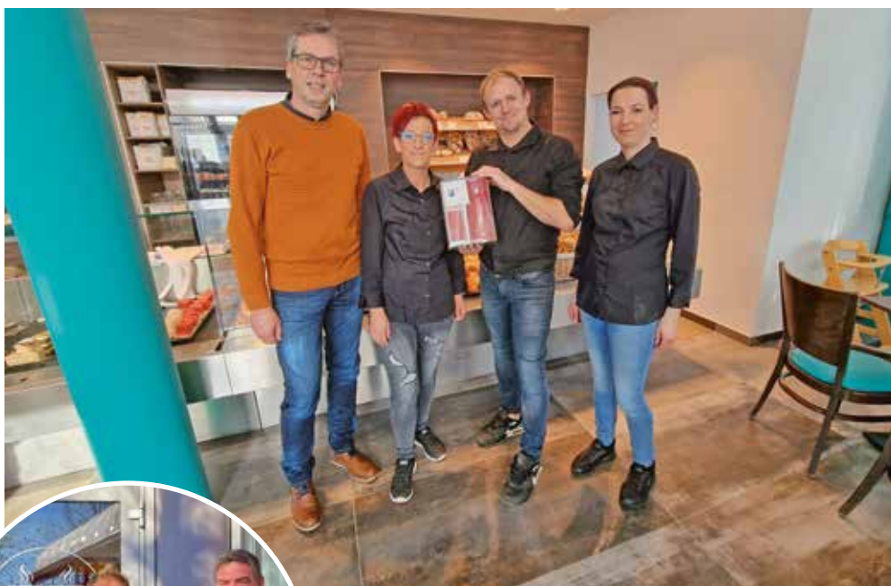
Die Bäckerei Brandl aus Möderbrugg ist ein Familienbetrieb mit 60 Jahren Tradition und beliefert Mr. Coffee mit frischen Backwaren und Süßspeisen.