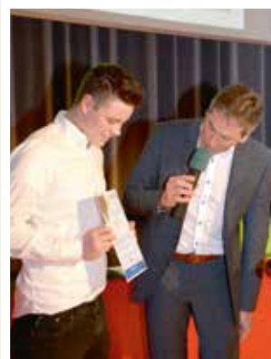
... der den Gutschein für eine Hochgenuss- Ballonfahrt mit nach Hause nehmen konnte.