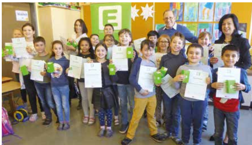
Dir. in Joham, SU-Lehrerin Gomsj und Ing. Baierl mit den neuen Energieschlaumeiern der 3a-Klasse

■ Kinder so früh wie möglich für den Klimaschutz zu begeistern und umweltbewusstes Handeln zu fördern sieht die Stadtgemeinde Spielberg als wichtigen Auftrag. Dank hervorragender Zusammenarbeit mit