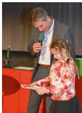
Unser „Glücksengel“ zog aus den mitgebrachten Einladungen den Gewinner, ...